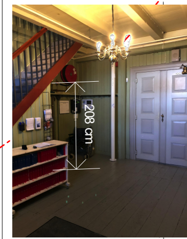
ILLUSTRASJON FORSLAG HEIS UNDER TRAPP